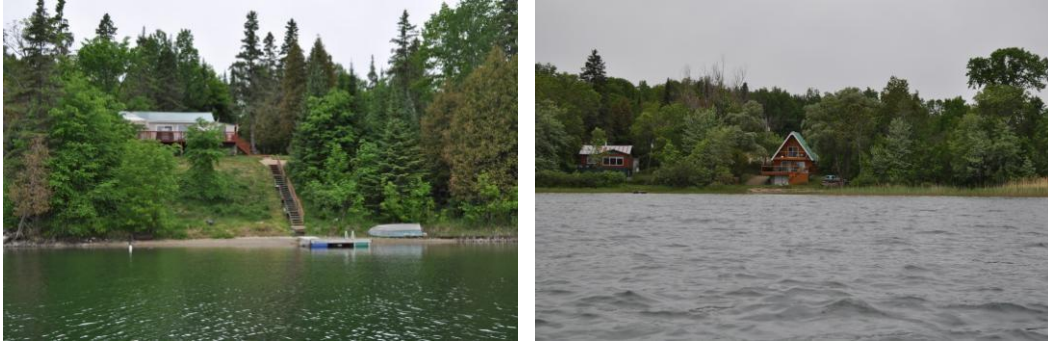
Figure 21: Exemples de rives aménagées avec une pente abrupte (à gauche) et à même le niveau de l'eau (à droite)

La majorité des pentes autour du Grand Lac Rond se situent autour d'un pourcentage de 30 à 60 %.